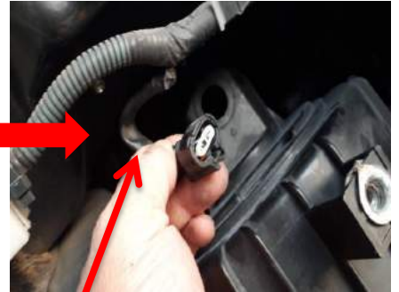
延長カプラーとセンサー側をカプラーオン